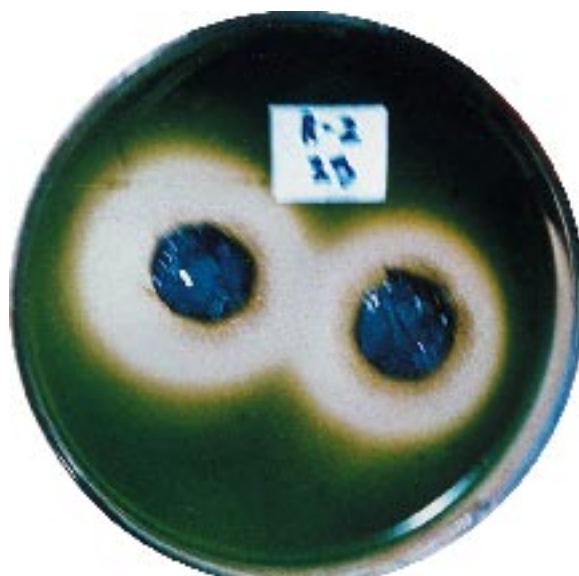
Рис. 3. Угнетение роста зеленых водорослей на поверхности среды в чашке Петри гербицидом, образованным цианобактерией (гербицидом пропитана бумага, положенная на поверхность среды).

К сожалению, довольно многочисленные цианобактерии образуют токсины, губительные для животных и человека. Это представители родов Microcystis , Anabaena , Nodularia , Nostoc , Aphanizomenon , Oscillatoria и др. Способность к образованию яда не видовой признак, а свойство штамма или клона, то есть здесь наблюдаются внутривидовые различия. Яды образуют главным образом планктонные формы. Токсины бывают двух типов — нейротоксины или гепатотоксины. Первые представляют собой алкалоиды, действующие на нервную систему. Цианобактерии, образующие нейротоксины, встречаются относительно редко. Гепатотоксины — это циклические гепто- или пентапептиды (то есть ко-