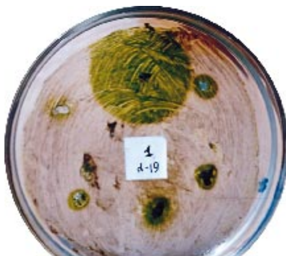
Рис. 4. Угнетение грибка и рост зеленых водорослей на поверхности среды вокруг бумаги, пропитанной антибиотиком, образованным цианобактерией.

роткие цепи белковой природы, составленные пятью или шестью аминокислотами), содержащие необычные аминокислоты. К настоящему времени описано множество разновидностей таких пептидов, различающихся структурой и степенью токсичности. Гепатотоксин, попавший в организм животного, вызывает разрушение печени, и через несколько часов наступает смерть. Низкие дозы яда вызывают развитие рака. Случаи гибели людей от гепатоток-